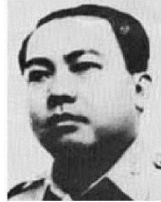
Th. Tướng Trần Tử Oai 1963