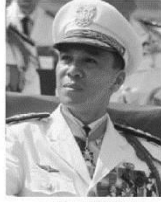
Trung Tướng Nguyễn Văn Thiệu 1955-1957/1958-1960